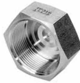
Tapón hembra FIG 300